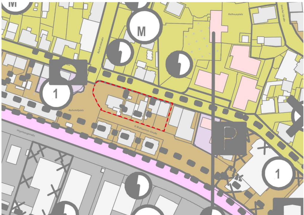
Flächennutzungsplan von Dettingen an der Erms – (In Kraft seit 17.04.1999)