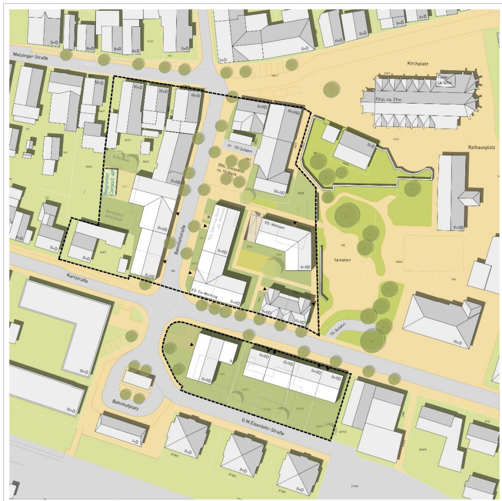
Abbildung: städtebaulicher Entwurf (citiplan. GmbH, 12.08.2024)

Die Gebäude im Süden nehmen die Straßenflucht an der Karlstraße und die Körnung der umgebenden Gebäude auf. Der offene Bereich gegenüber von „Sorglos Wohnen“ wird gespiegelt und somit der Bahnhofplatz Richtung Altstadt geöffnet.